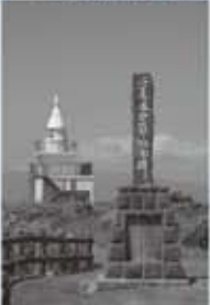
昭和7年、江差町に建立された「江差追分灯台」

「ふるさと探訪」は、歌に連れられてふるさとを探訪するコーナーです。ここでは、ふるさと探訪の代表曲として「ふるさと探訪」が挙げられます。